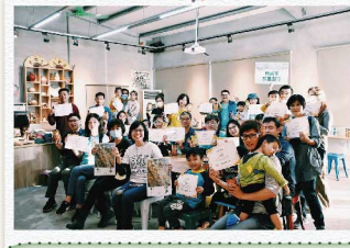
12 感謝參與活動的每一位同仁與眷屬（照顧小朋友的爸爸媽媽辛苦了～），期待「永續」的種子，透過集團成員與合作夥伴的雙手，持續傳遞到更遠更廣的社會角落！