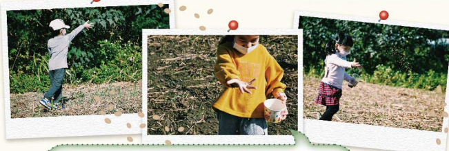
8 進入麥田種麥囉～12月正是小麥播種的季節，小朋友們嘩啦啦地撒出手中的小麥種子！