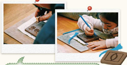
7 享用完滿足的午餐後，下午一起來製作屬於自己的紅磚杯墊～