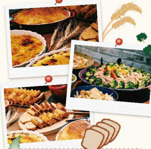
6 結束上午的導覽行程，接著來到「月光下友善農場」，迎接我們的是農場主人手作的精美小麥料理！