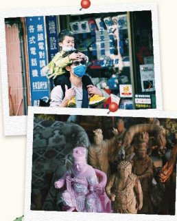
4 拜訪完廟宇後，走入麥寮老街，除了熱鬧的市場外，也有許多手工雕刻店。