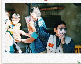
5 市場內傳統老餅舖現做的當地名產「鱷魚餐包」，酥脆的外皮加上香甜的花生餡，古早的好滋味吸引大家紛紛購入！