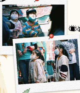
3 小朋友們也都張著好奇的眼睛，東看看西瞧瞧～

在同仁及眷屬的熱情參與下，大家一起認識在地環境、享用在地食材、體驗農家樂趣，一起感受這塊土地的美好，並且透過環境與惜食教育，讓我們更加珍惜得來不易的米糧。