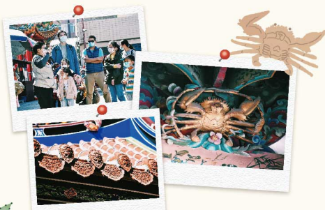
2 首先來到當地最負盛名的地標「拱範宮」，超過三百年的歷史建築，透過導覽老師講解，看到了我們平常不會注意到的小細節。