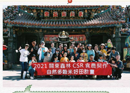
1 接續桃園場的活動，好田計畫第二站來到雲林麥寮！

雲林麥寮，在長期的產業轉移環境下，甚至有人覺得麥寮沒有藍天，但其實這裡不僅有藍天、有信仰、有文化、有傳家小吃，還有吹海風長大的台灣小麥，近年年輕人返鄉，重新演繹印象中的麥寮！