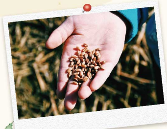
9 因為小麥是粗放作物，所以可以大方地撒播種子，後續為了避免種子被小鳥吃掉，還是會請撥土機將種子與泥土翻攪均勻。